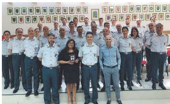
MIDOLLO OSSEO L'incontro nella sede della Gdf

Hanno partecipato la presidente regionale dell'Admo e due militari impegnati nella donazione