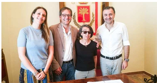
Protocollo d'intesa tra Comune di Bisceglie e CSV San Nicola © n.c.

Protocollo d'intesa tra Comune di Bisceglie e CSV San Nicola per sostenere i cittadini attivi