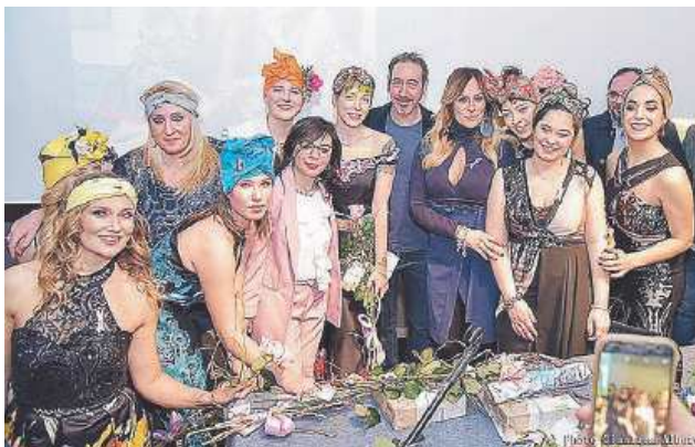
Le volontarie dell'associazione Divine del Sud