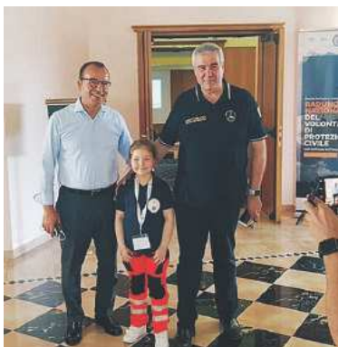
BABY-VOLONTARIA La piccola Pasqua tra Ruggiero Mennea e Angelo Borrelli

poiché oggi la Protezione civile di Rutigliano è in possesso di un parco di diversi veicoli attrezzati per intervenire in qualsiasi tipo di emergenza. La piccola Pasqua ha ricevuto un particolare riconoscimento dal presidente del Comitato permanente di Protezione civile della Puglia, Ruggiero Mennea . Anche il capo del Dipartimento della Protezione Civile italiana, Angelo Borrelli , ha voluto farsi immortalare con lei, issandola sulle sue spalle, additandola ad esempio per le nuove generazioni.