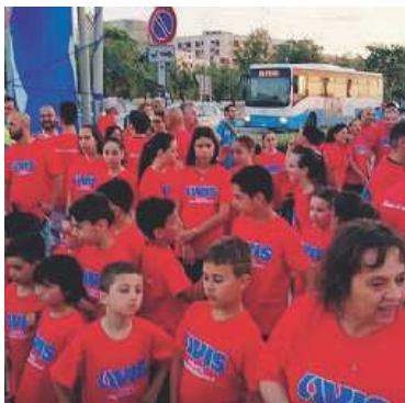
Un momento della gara 2018

Le iscrizioni dovranno pervenire entro e non oltre le ore 19.30 di giovedì 27 giugno, saranno a numero chiuso e in caso di esaurimento tagliandi, verranno chiuse anticipatamente le iscrizioni. La quota di partecipazione è di 2 euro e 50 centesimi per tutti i partecipanti e dà diritto a: Pettorale di gara; assicurazione rc e assistenza medica; pacco gara (T-shirt ufficiale AVIS da indossare obbligatoriamente); Pasta Party e/o Me-