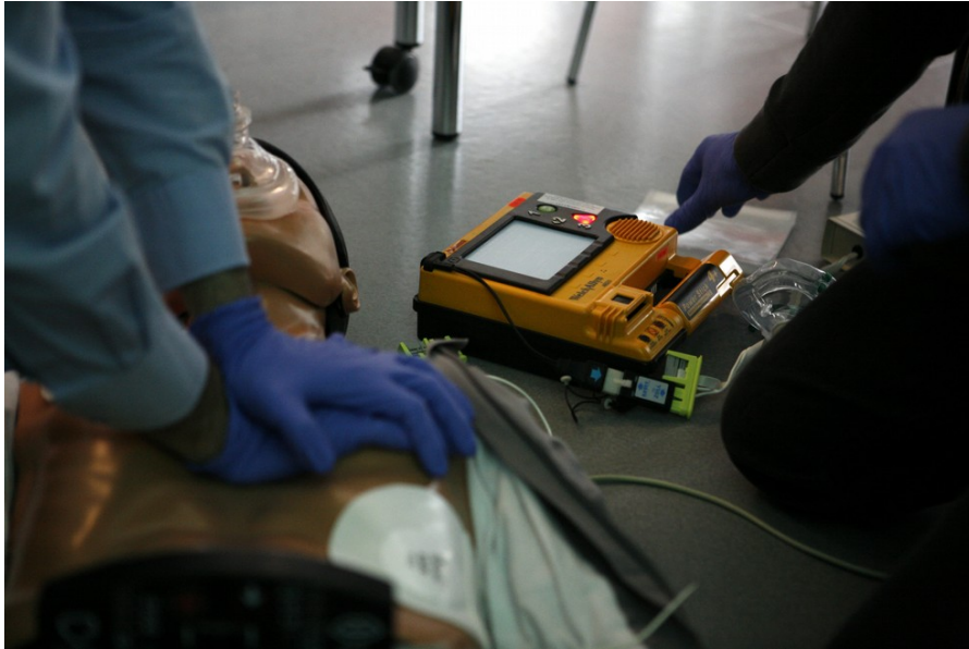
defibrillatore Scuola e Lavoro

Un altro defibrillatore si aggiunge a quelli già censiti ed inseriti nel Progetto di Defibrillazione Pubblica avviato dal Centro di Formazione IRC" GIFES" e dalla Misericordia Corato. È quello dell'istituto Tannoia di Corato.