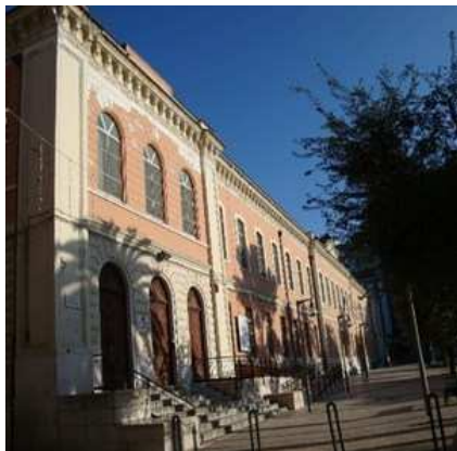
Scuola D Azeglio

Si propone la realizzazione presso i piani seminterrati dell'edificio che ospita la scuola elementare Massimo D'Azeglio