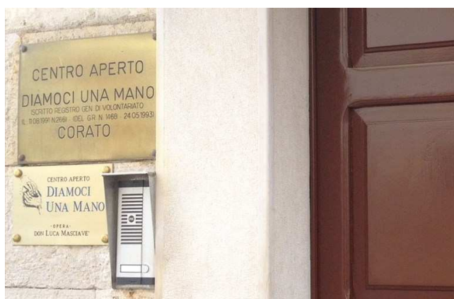
L'ingresso del centro aperto Diamoci una mano

L'iniziativa intitolata “Incontrarsi. Racconti di Odissee fiorite”, si terrà giovedì 13 giugno alle 19 nel giardino della chiesa dei Cappuccini, in viale IV Novembre