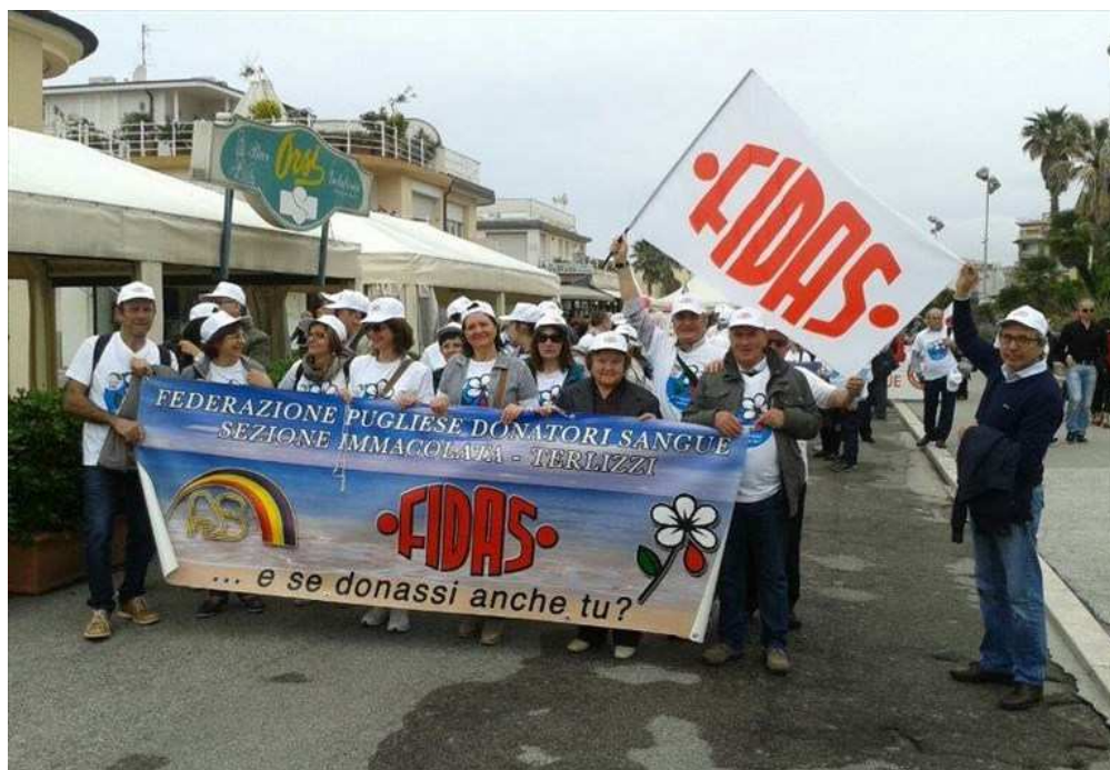
la fidas terlizzi a viareggio