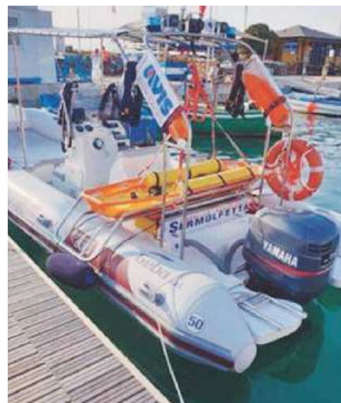
VOLONTARI Il nuovo gommone del Ser Molfetta

Nello specifico, il servizio di pattugliamento sarà svolto dal 15 giugno al 1 settembre ogni giorno dalle 10 alle 13 e dalle 15 alle 18 con l'utilizzo di un'ambulanza di tipo A e di un gommone dotati di defibrillatore e personale