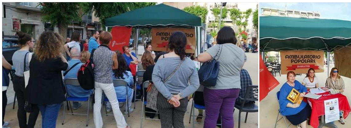
Uniti per i Diritti umani