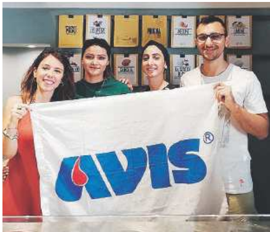
INSIEME Il gruppo Avis da «Scoop»

L'omaggio delle gelaterie per incrementare le donazioni di sangue