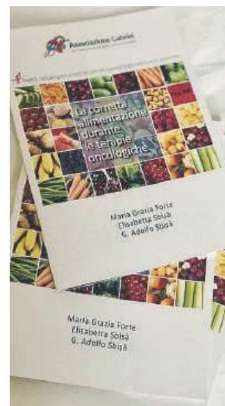
COPERTINA Il volumetto