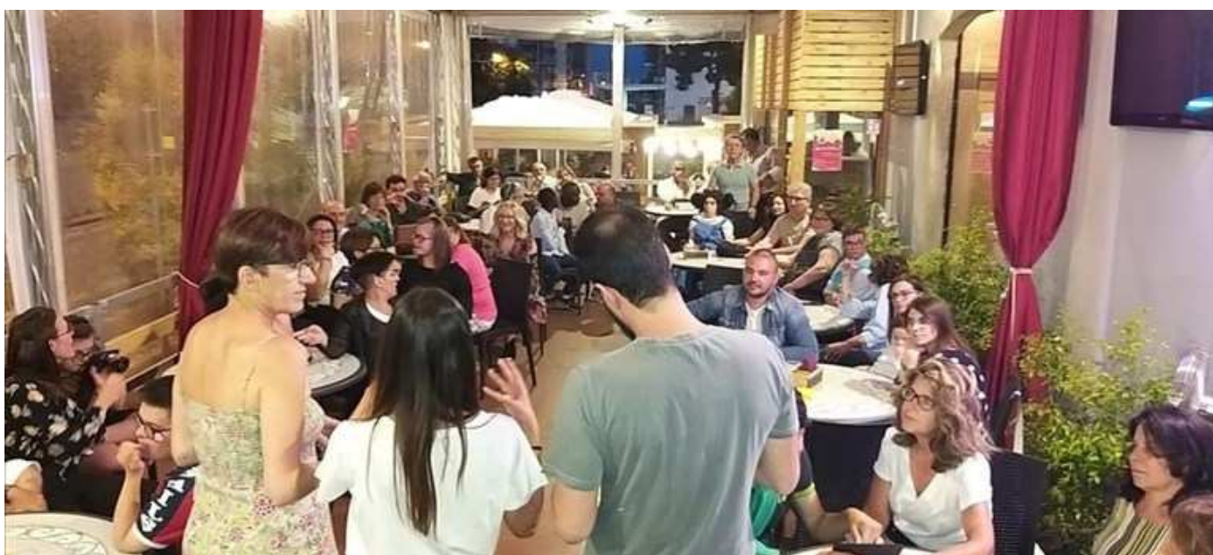
Camminare insieme "a piccoli passi", foto della serata

Si è tenuta ieri la festa di chiusura per la pausa estiva delle attività dell'associazione che è impegnata nella realizzazione di progetti e iniziative di inclusione sociale e di autonomia con i disabili e le loro famiglie