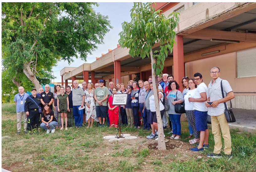
targa giovanni montanaro monopoli