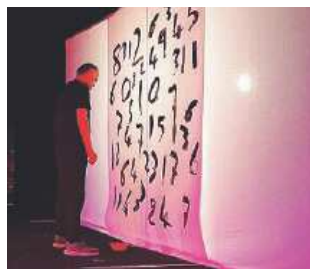
IL FESTIVAL Il giullare

in un rispettoso silenzio, hanno poi applaudito a scena aperta un gruppo che, anno dopo anno, sale di livello e mostra di essere una compagnia sempre più affiatata, in grado di trasmettere messaggi forti e, soprattutto, commuovere.