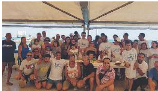
ANGSA DI BARLETTA Ieri la «passeggiata in mare»

rità hanno aiutato i ragazzi autistici a poter stare in acqua.