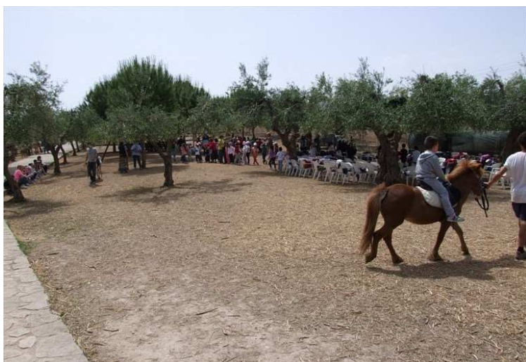
Il parco archeologico di Santa Geffa

Si comincia il 25 Luglio 2019 ore 16.00 fino al 17 Agosto con una conclusione tutta dedicata alle parole della giustizia e legalità in collaborazione con Libera Associazione contro le Mafie