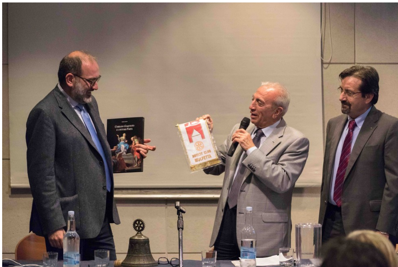
Conferenza "Social Market Solidale".