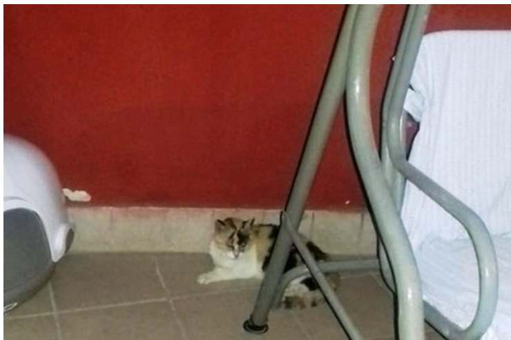
Pupa nella sua nuova casa