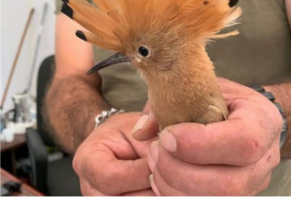
L' Upupa salvato