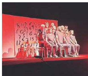
Una scena dello spettacolo

Io. La rinascita inizia con i dieci attori riparati da un ombrello, per proteggersi dalle intemperie dei problemi che affliggono la vita di ciascuno di loro. Poi lo richiudono e, sedendosi in ordine sparso, devono affrontare altre avversità che