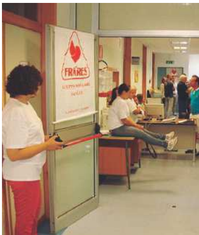
REPARTO Donatori di sangue con Fratres

Una storia, quella della Fratres della Parrocchia del Prez.mo Sangue, che si perde nel lontano 1996, ai tempi della prima donazione nelle aule del catechismo trasformate in ambulatorio. Si raccolsero 50 sacche, un successo, ma poi la raccolta è andata sempre aumentando fino a 280 all'anno. E nel tempo, anche per una maggiore attenzione sanitaria da parte dell'ASL, la donazione viene fatta 4 volte all'anno nel pulman dell'autoemoteca mandata dal Policlinico in parrocchia. Insomma, venerdì 18 sarà una giornata di festa e di condivisione. Perché nulla può avvenire senza l'intenzione di far parte di qualcosa di più grande, come la famiglia della Fratres.