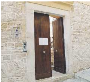
VOLONTARI Casa accoglienza Goretti