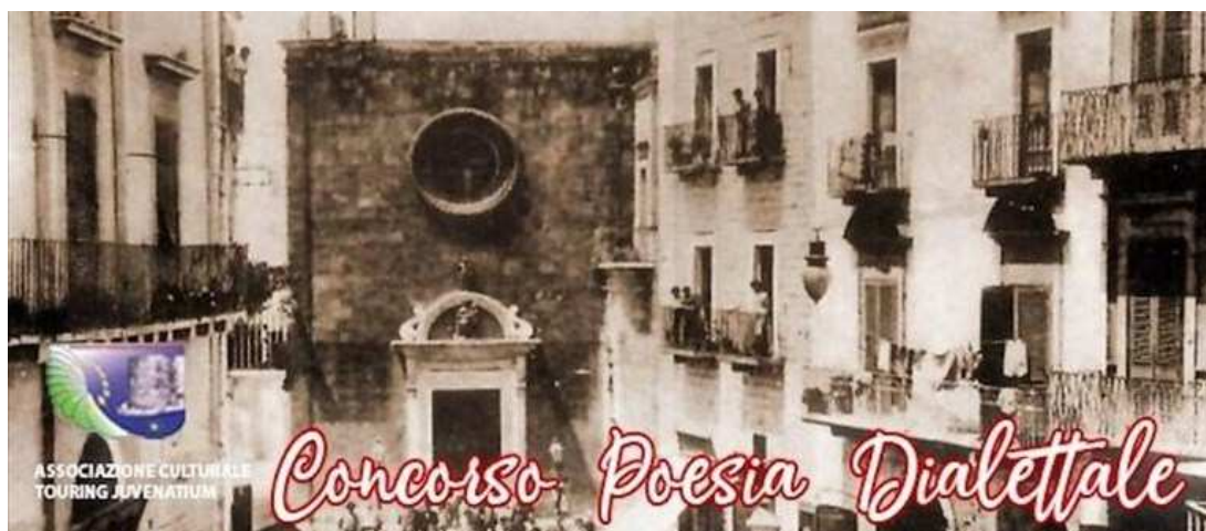
Concorso si poesia in vernacolo di Touring Juvenatium © Nc

Il tema di quest'anno: "Arrecherdènne l'addèur e le guste de 'na volte... a Scevenazze". (Ricordando sapori, odori e profumi di un tempo...a Giovinazzo). L'11 novembre la scadenza per le iscrizioni