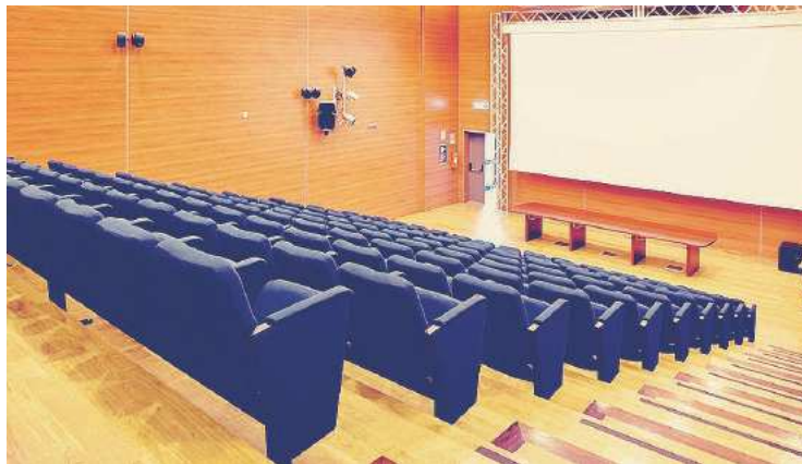
AL SAN PAOLO La sala del Centro Multimediale «Karol» della Fondazione Giovanni Paolo II