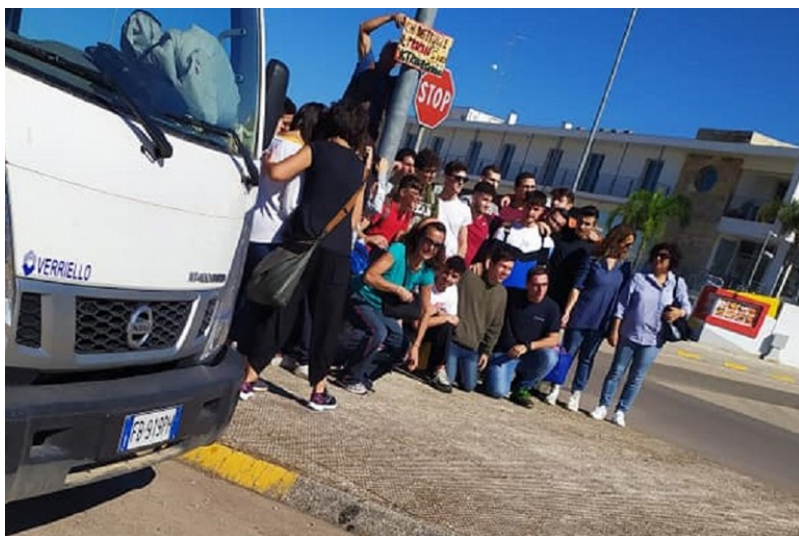
Tutti insieme per difendere