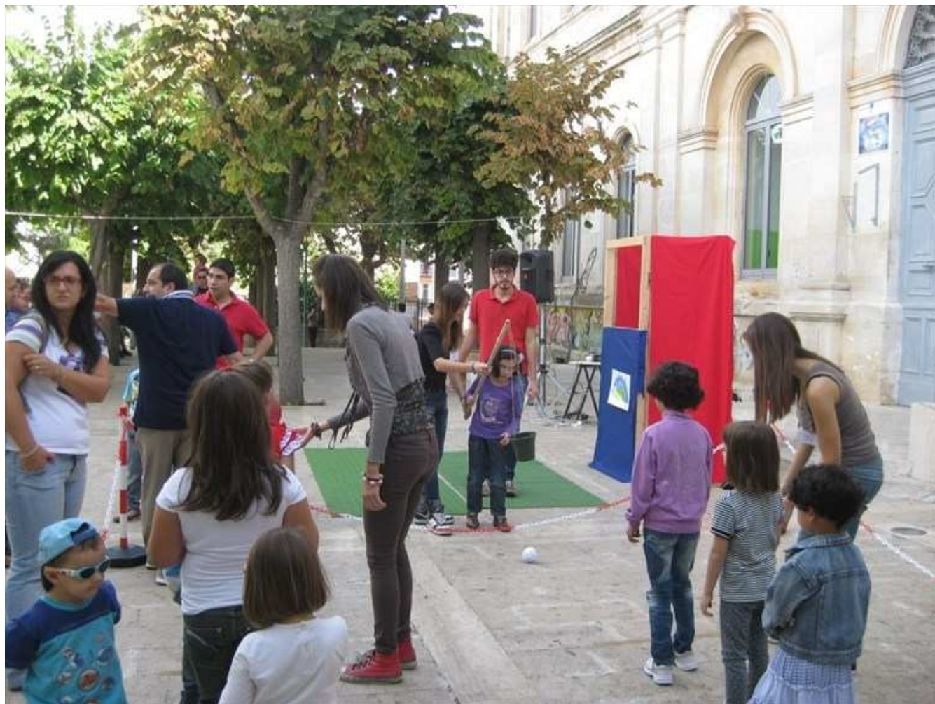
Fantaora, l'appuntamento ludico con i volontari della C.A.Sa

Un viaggio entusiasmante in compagnia dei grandi classici della letteratura per ragazzi.