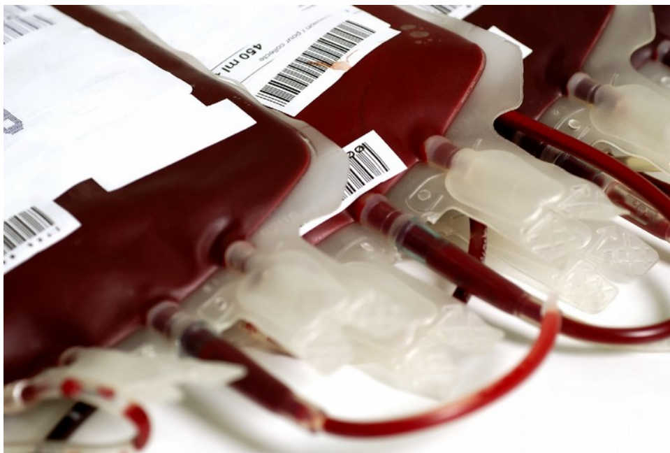
L'équipe trasfusionale nel centro raccolta dell'ospedale

Una nuova donazione straordinaria di sangue promossa dalla sezione Avis Bisceglie si terrà domenica 27 ottobre. In mattinata, a partire dalle ore 8 alle 11, l'équipe trasfusionale sarà a disposizione dei donatori nel centro raccolta sangue dell'ospedale civile "Vittorio Emanuele II" di Bisceglie.