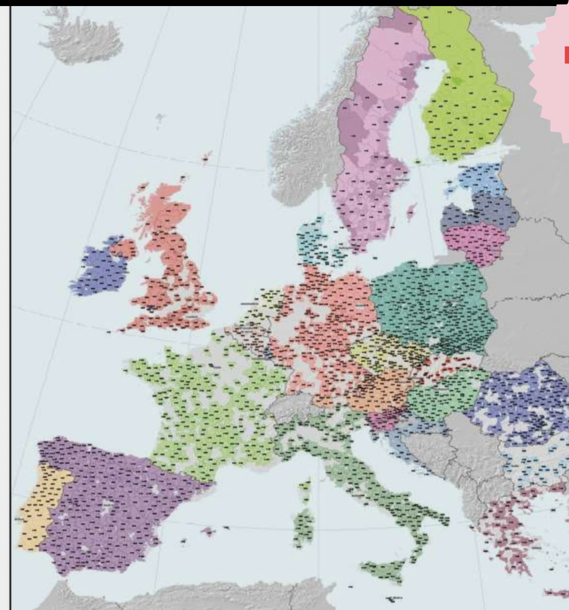
I 1.751 Gal dei paesi europei dove di venera San Nicola