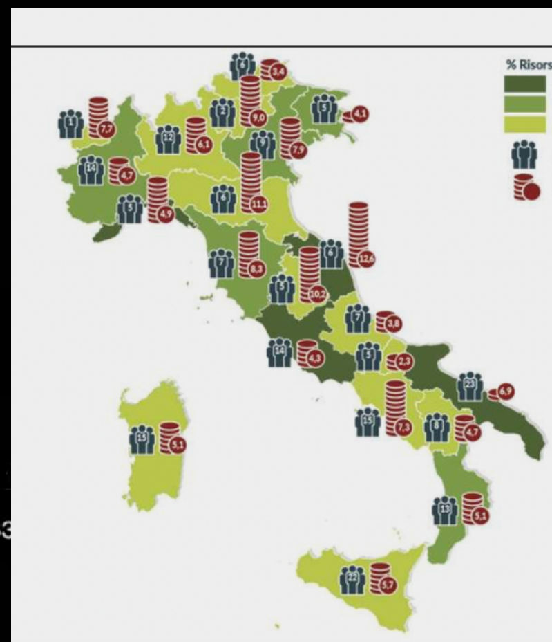
I 192 Gal Italiani