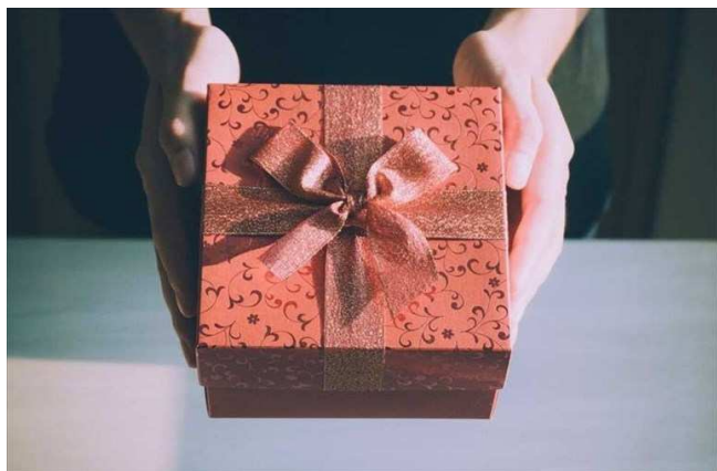
Dono San Nicola

Circa 250 bimbi riceveranno i doni, alcuni direttamente a casa, altri potranno ritirarli presso la sede dell'Auser