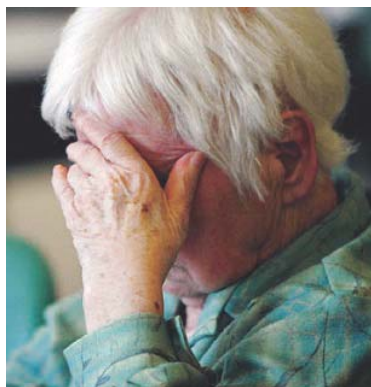
PUTIGNANO Un sostegno ai malati di Alzheimer

Il gruppo si riunisce ogni due settimane, sempre di mercoledì, per un totale di dieci incontri, sotto la su-